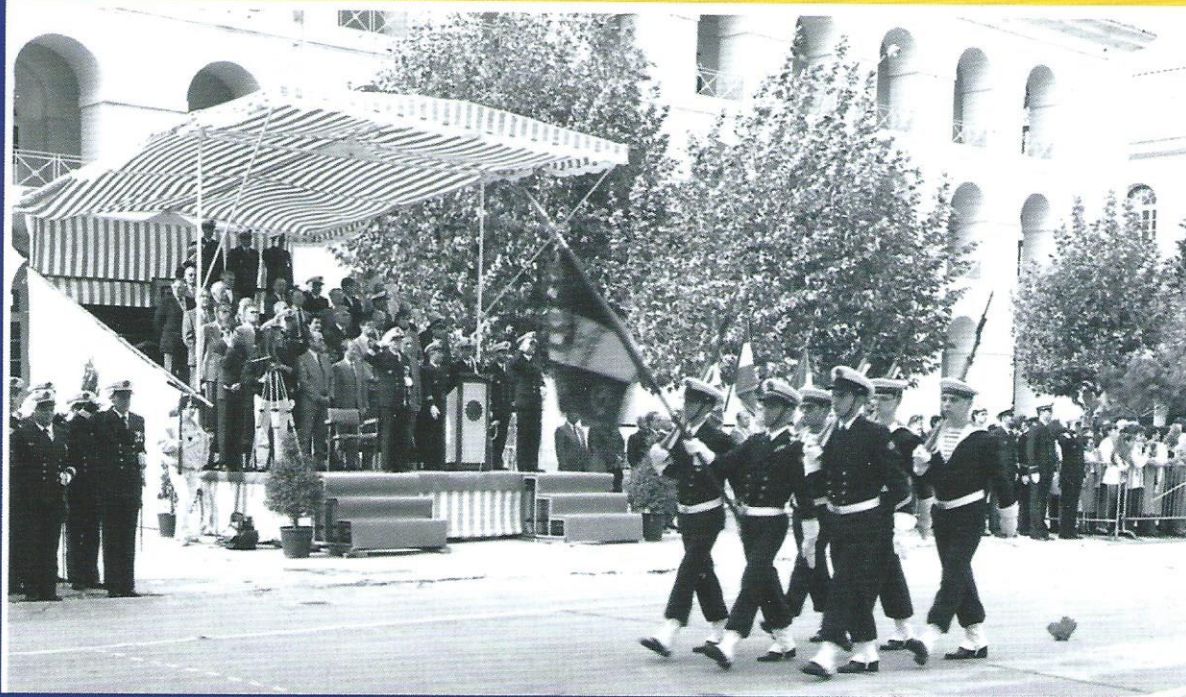
1987, un défilé au GEM